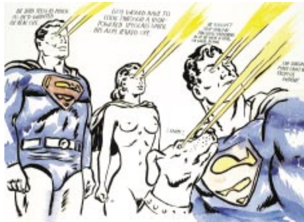
He had seen as much... , 1998. Colección Dean Valentine y Amy Adelson, Los Ángeles. Cortesía Regen Projects, Los Ángeles. © Raymond Pettibon, 2002