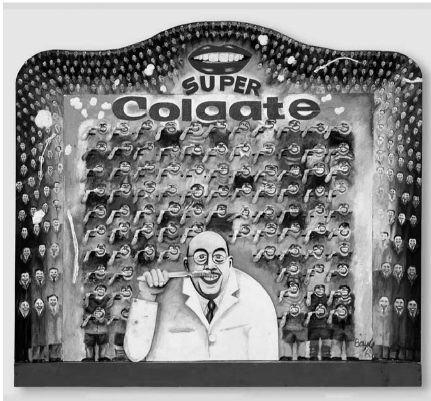
Thomas Bayrle, Super Colgate / Zahnputzer , 1965. Museum am Ostwall Dortmund. © Thomas Bayrle, 2009