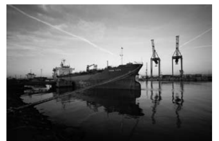
Allan Sekula, Terminal de inflamables, Barcelona. Dos petroleros al amanecer , 2007. © Allan Sekula, 2009

Partiendo de la vocación de que las imágenes tengan un uso público, pueden solicitarse los archivos de alta resolución en el Centro de Estudios y Documentación del MACBA. Para ello es necesario escribir un correo electrónico a arxiu@macba.cat con una descripción del uso final que quiere darse a las imágenes requeridas.