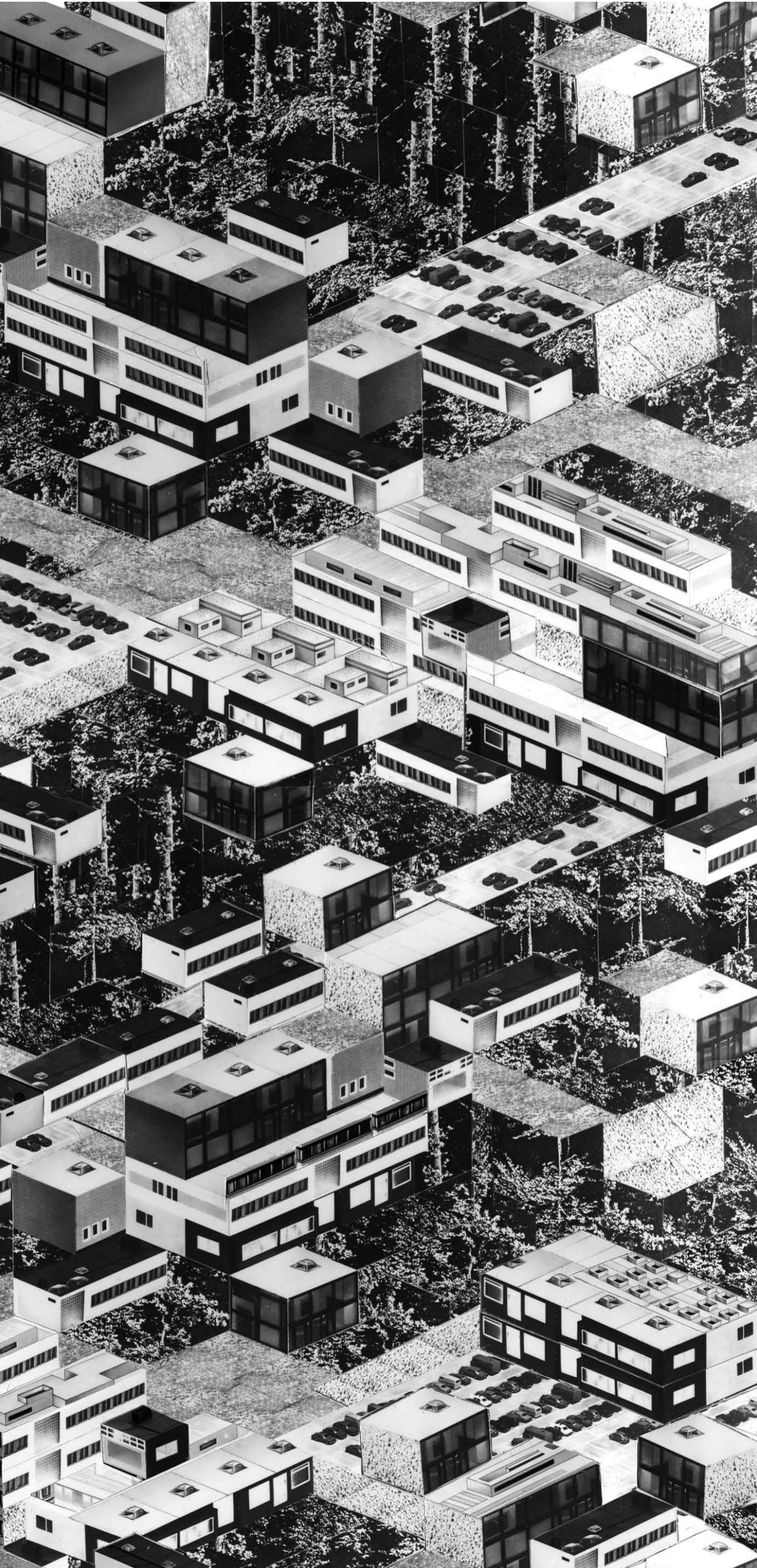
Thomas Bayle, Yamaguchi , 1981. Cortesía Galerie Francesca Pia, Zürich, Galerie Barbara Weiss, Berlín. Foto de Wolfgang Günzel © Thomas Bayle, 2009