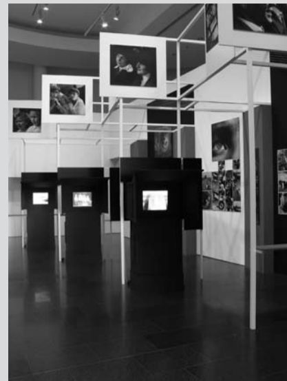
Reconstrucción del pabellón soviético de la exposición Internationale Ausstellung des Deutschen Werkbund. Film und Foto (1929) en la exposición Archivo universal. La condición del documento y la utopía fotográfica moderna , MACBA, Barcelona, octubre de 2008 - enero de 2009

Se trata de un seminario que busca facilitar, por un lado, una perspectiva histórica de los tránsitos al modelo «productivista» y otras experiencias parejas de radicalización de las vanguardias históricas; por otro lado, un análisis de cómo las problemáticas, hipótesis y modelos (artefactos, mecanismos, prototipos) puestos en juego en aquel periodo histórico, adquieren nuevas resonancias en las últimas décadas, en las que estamos experimentando una «revolución» en los modos de producción, de distribución o de información. Al mismo tiempo también se pretende generar una discusión en torno a casos concretos en los que determinadas prácticas recientes encuentran en esos modelos históricos el trasfondo sobre el que