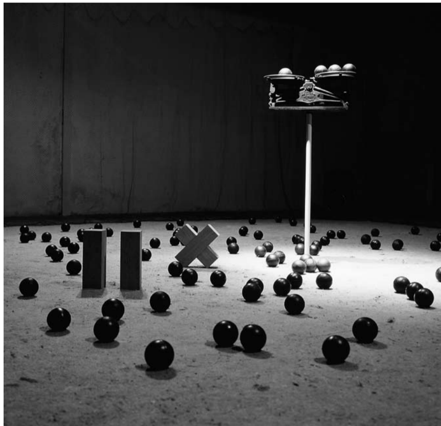
Cildo Meireles, Eureka/Blindhotland, 1970-1975. Tate. Donación de la American Fund para la Tate Gallery, 2007.

Coincidiendo con la exposición, el Centro de Estudios y Documentación presenta una panorámica documental sobre Brasil que reúne materiales procedentes, en su mayoría, de los fondos del propio centro. Para esta selección, la documentación que se presenta se ha agrupado de acuerdo con diversos ejes en función de su tipología y sus contenidos. Así, además de una selección dedicada a Cildo Meireles, que incluye no solo bibliografía sobre su obra sino también ejemplares de la revista Malasartes , fundada por Meireles y de la que solo llegaron a editarse tres números (entre septiembre de 1975 y junio de 1976), se exponen algunos libros de gran relevancia en relación con el movimiento de la poesía concreta brasileña; una selección de catálogos de muestras individuales y colectivas; numerosas publicaciones relacionadas con las bienales de arte de Río de Janeiro y São Paulo, y también revistas, libros especiales, carteles y otros materiales efímeros que ilustran la escena artística de Brasil a lo largo de las últimas décadas.