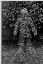
Fina Miralles, Recobrimient del cos amb palla , 1975. Col·lecció MACBA. Procedent del Fons d'Art de la Generalitat de Catalunya. Foto de Rocco Ricci. © Fina Miralles, 2009