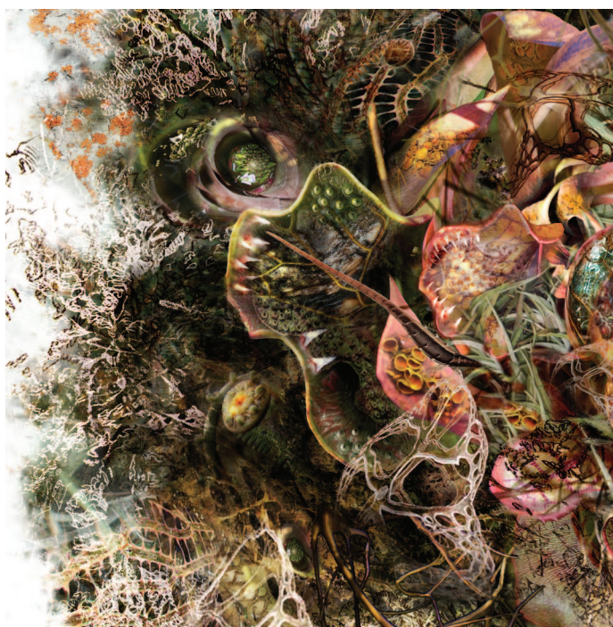
Rohini Devasher, Deriva genética: Symbiont 2 - Cavum Oris Plantae , 2018

Exposició del 31 d'octubre de 2018 al 17 de març de 2019