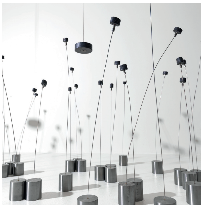
Takis, Magnetic Fields (detall), 1969. Solomon R. Guggenheim Museum, Nova York. Donació parcial, Robert Spitzer, per intercanvi, 1970. © ADAGP, París i DACS, Londres 2019.

Exposició del 22 de novembre de 2019 al 19 d'abril de 2020