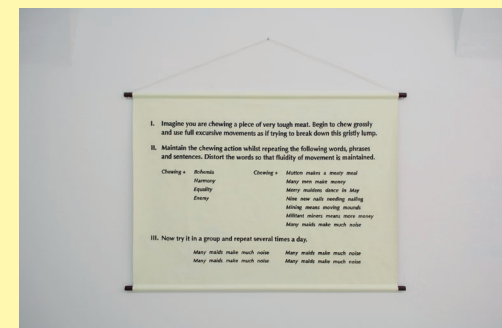
Learning to Speak Sense , peça sonora amb instruccions a mà (vista de la instal·lació). Ar/Ge Kunst, Bolzano, 2015