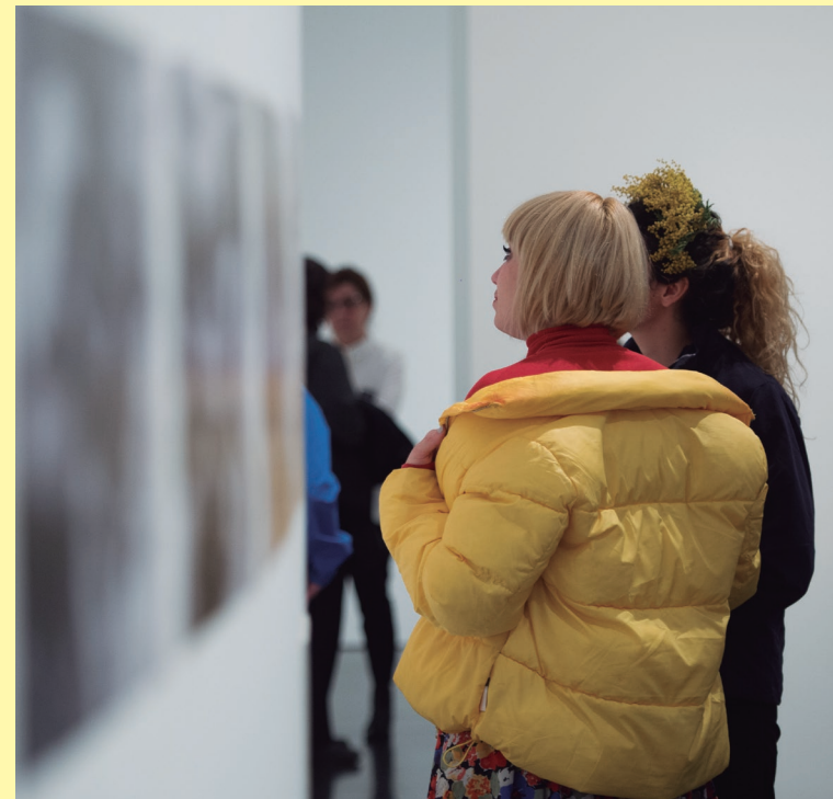
Vista de les sales del museu. Foto: Miquel Coll, 2019

L'obra de David Levine comprèn teatre, performance, vídeo i fotografia. Les seves performances i treballs expositius s'han presentat al Brooklyn Museum, Creative Time, MoMA, REDCAT, The MCA Chicago, Mass MoCA, PS122 i Boston Museum of Fine Arts, i també ha aparegut a Artforum, Frieze, Theater, BOMB, The New Yorker i The New York Times. La seva exposició individual al Brooklyn Museum, Some of the People, All of the Time , va ser inclosa dins la llista de les deu millors exposicions internacionals per The New York Times el 2018.