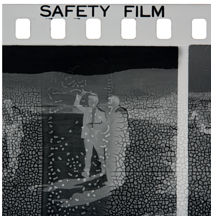
Akram Zaatari, Safety Film , 2017 (detalle). Ampliación de un negativo de 35 mm de Antranick Bakerdjian, Jerusalén, década de 1950

Exposición del 7 de abril al 25 de septiembre de 2017