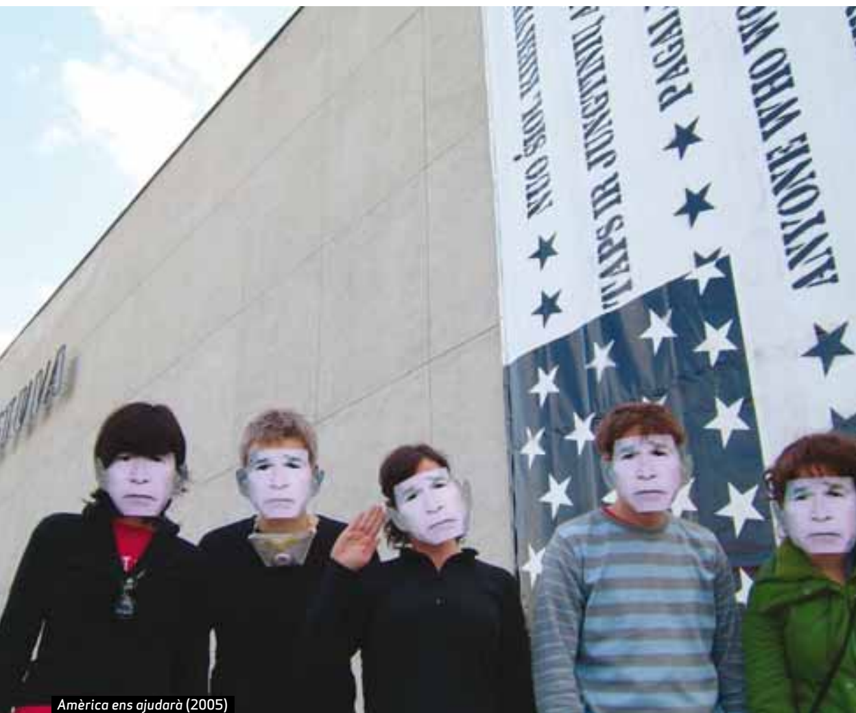
Amèrica ens ajudarà (2005)