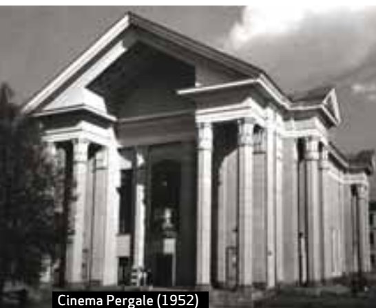
Cinema Pergale (1952)