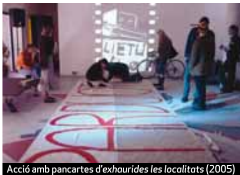
Acció amb pancartes d'exhaurides les localitats (2005)