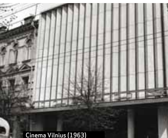
Cinema Vilnius (1963)