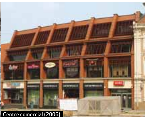
Centre comercial (2006)