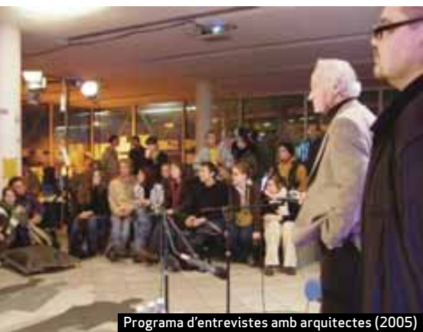
Programa d'entrevistes amb arquitectes (2005)

El març de 2005, l'antiga taquilla del cinema Lietuva de Víliaus va ser ocupada i convertida en un laboratori que convidava el ciutadà a proposar diferents escenaris de protesta, tant per moure a l'acció com per fer-la possible. Tot i que el punt de partida va ser un estudi sobre la destrucció del cinema Lietuva –l'edifici d'arquitectura soviètica moderna més gran de Lituània–, es va convertir en un espai i un arxiu de diverses formes de protesta (i accions legals) contra la privatització corporativa de l'espai públic.