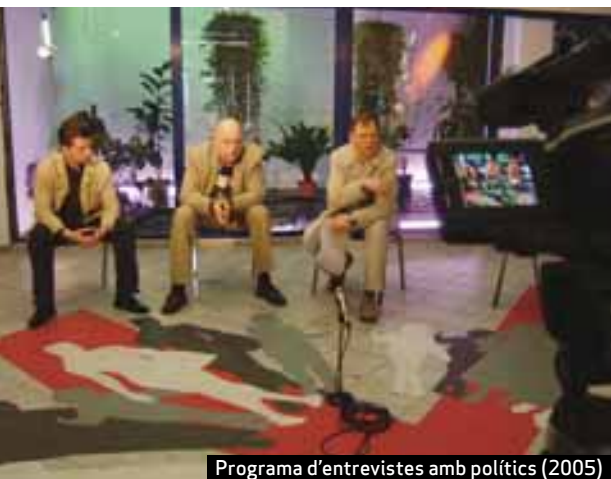
Programa d'entrevistes amb polítics (2005)

Si la protesta és impossible, si la resistència és inimaginable, ¿quina mena d'estratègia artística es podria utilitzar per generar algun tipus de protesta? I si no hi ha protesta, ¿podem provocar-la o incitar-la d'alguna manera? Com podem accedir a les contradiccions que s'amaguen en un espai determinat? 10