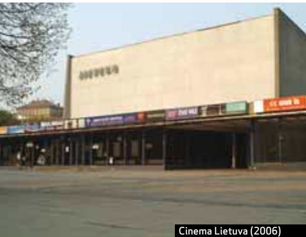
Cinema Lietuva (2006)

Des de la proclamació de la seva independència el 1990, Lituània s'ha vist atrapada en una voràgine de privatitzacions, promocions immobiliàries i demolicions. Com en el període d'apropiació de terres que va tenir lloc a l'Oest Llunyà o en l'època de la febre de l'or, els especuladors i magnats de la indústria immobiliària han unit forces amb els buròcrates municipals corruptes per reconstruir el país a un ritme delirant. L'únic motiu n'ha estat el benefici econòmic. El seu mètode és simple: explicar a la població que en l'economia de mercat tot s'hi val; convèncer-los que el capital és l'amo i senyor; recordar al poble que el fet que Lituània sembli una gran ciutat capitalista és la millor manera d'esborrar el passat soviètic... i aconseguir que el país atregui encara més inversions i promocions immobiliàries.