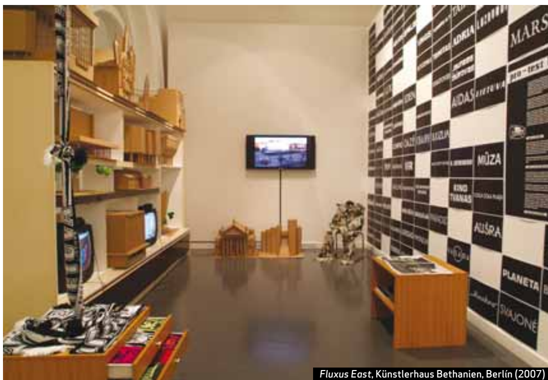
Fluxus East, Künstlerhaus Bethanien, Berlin (2007)