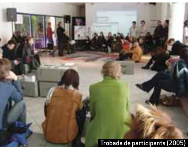
Trobada de participants (2005)

Es podria dir que les pràctiques culturals, urbanes i activistes que reivindiquen la protesta, la recuperació de l'espai públic, provenen de la tradició cultural democràtica occidental. El passat repressiu de la Unió Soviètica simplement va esborrar aquestes activitats de la memòria del poble. Ara, el discurs de la protesta ja no és possible. Protestar significa mirar enrere, enyorar un passat que remet a l'estalinisme i a la repressió massiva que portava directament al Gulag. Per això, en l'espai postsoviètic la noció de protesta i la ideologia d'esquerres tenen un significat negatiu. 9