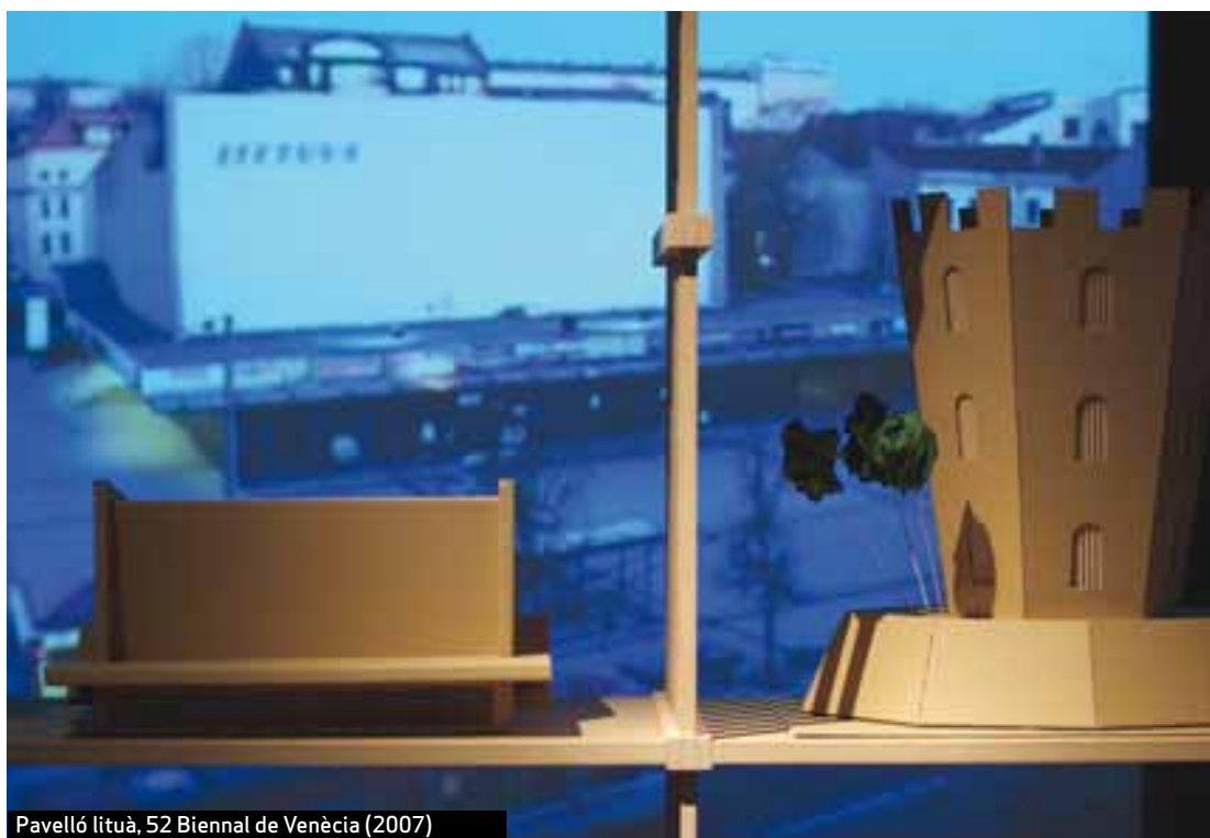
Pavelló lituà, 52 Biennal de Venècia (2007)