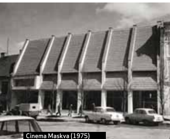
Cinema Maskva (1975)