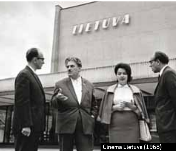
Cinema Lietuva (1968)