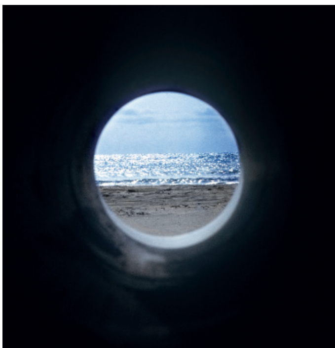
Nancy Holt, Views through a Sand Dune (Vistes a través d'una duna, 1972) [detall] © Holt/Smithson Foundation / ARS, NY / VEGAP

Exposició del 13 de juliol de 2023 al 7 de gener de 2024