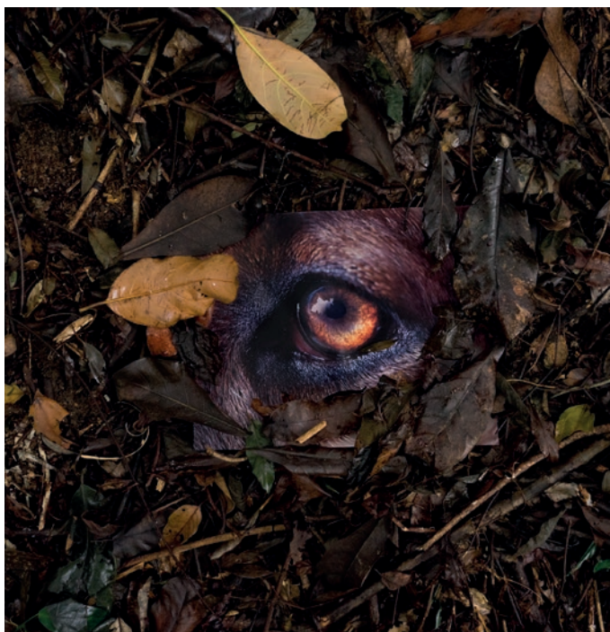
Daniel Steegmann Mangrané, La Pensée Férale (detalle), 2020

Exposición del 16 de noviembre de 2023 al 20 de mayo de 2024